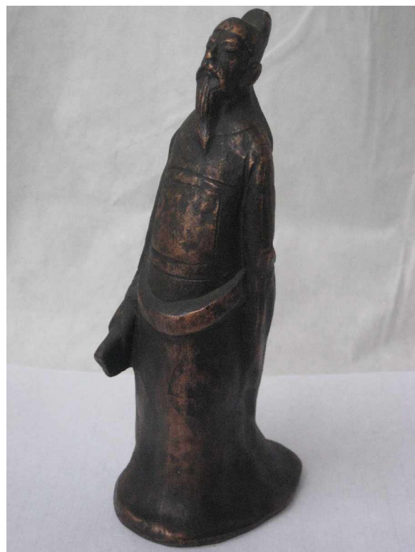
仿古青铜——柳宗元像