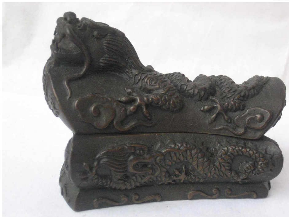
仿古青铜——柳州棺材