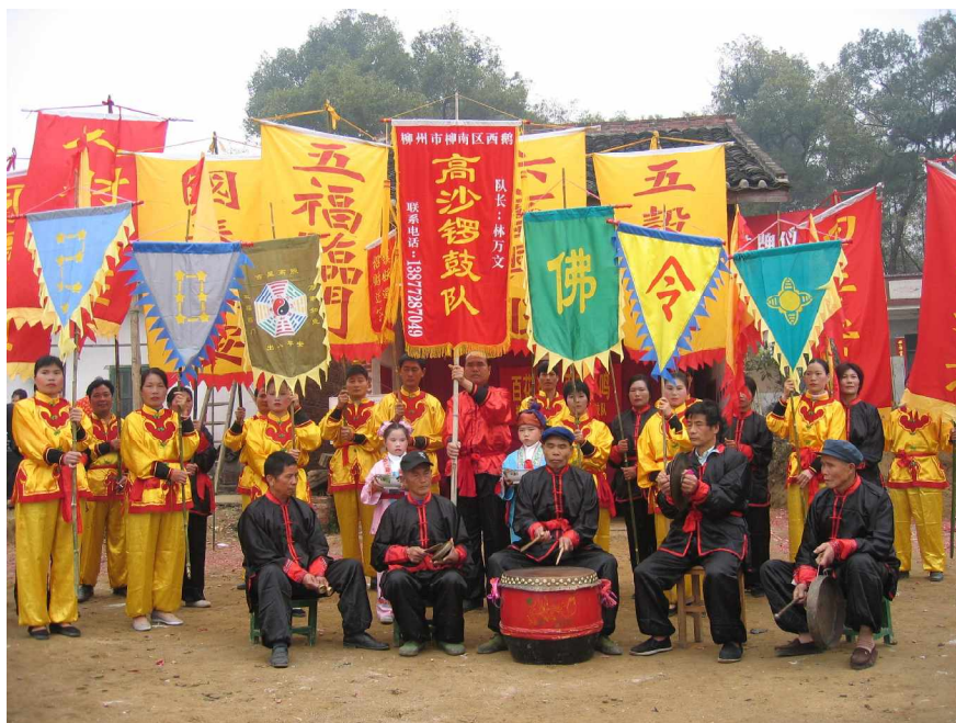
柳南区高沙锣鼓队