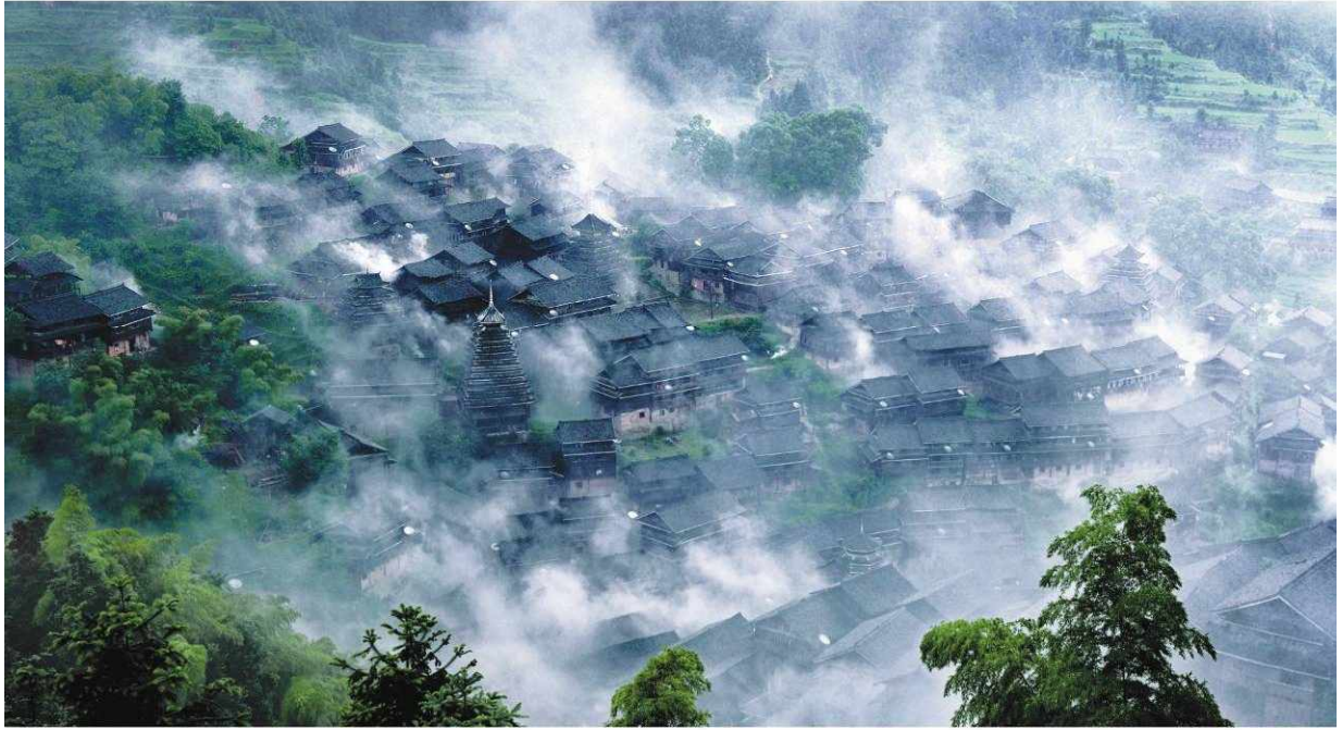
《神秘的侗寨》