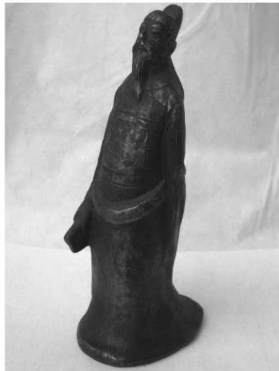
仿古青铜——柳宗元像