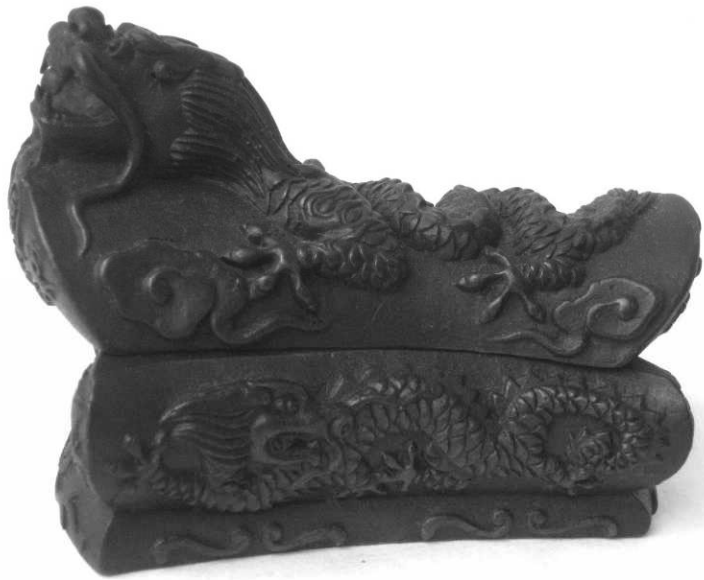
仿古青铜——柳州棺材