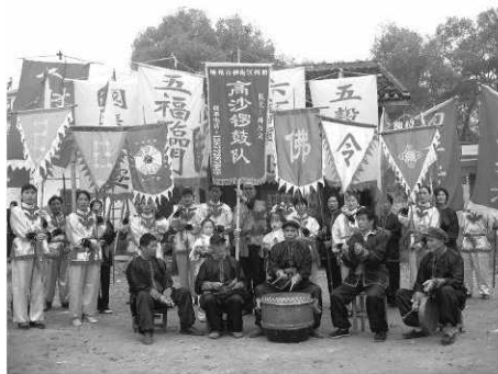
柳南区高沙锣鼓队