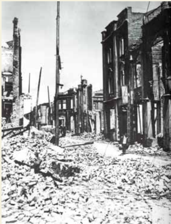
← 1944年9月27日,被日军飞机轰炸后的柳州城一角。(摘自《图说柳州抗战》)

“湘桂会战第二期作战取得赫赫战果:占领了桂柳两个重要空军基地,并追击远至贵州省……同时控制了黔桂铁路要域。在物资损耗方面,弹药达2万多吨,武器达数千吨,相当于40个师以上的装备,相当于中国军队一年度的