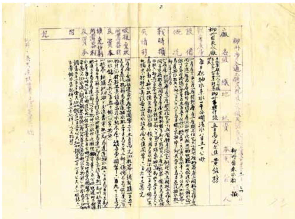
→柳州电厂房屋损失清单。

当逃难的灾民从外地返回时发现，他们已经失去了赖以生存的家园，瓦砾焦木间见到的是无人掩埋的尸体，断壁残垣上新写下回来又离去者潦草的留言。由于居无所、食无粮，刚从战争废墟中站起来的人们又笼罩在死亡的阴影里，瘟疫（霍乱、天花、