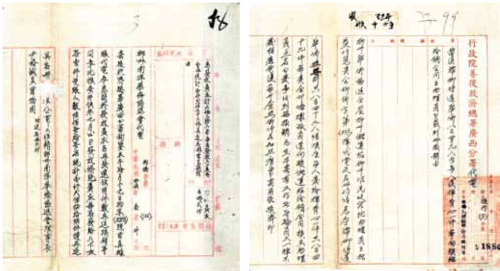
←左：柳州南洋华侨协进会上报联合国善后救济总署广西分署，9月4日该会630名侨胞领得上下衣各1件，共1266件旧衣。右：行政院善后救济总署广西分署代电复柳州华侨协进会滞柳待遣华侨849人准每人发棉背心1件。